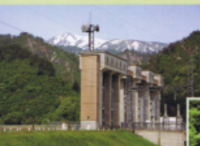
只見ダムから見る浅草岳

2つのダムの歴史と只見の自然にふれるコース。プナと川のミュージアムで只見の自然について学んだら、Jパワー只見展示館でダムの歴史や構造を学びます。最後は、日本第3位の貯水量を誇る田子倉ダムへ。ダムサイトからの眺めは最高ですよ！