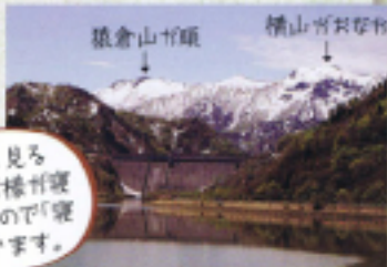
横山山荘 横山山荘