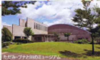
ただみ・プナと川のミュージアム