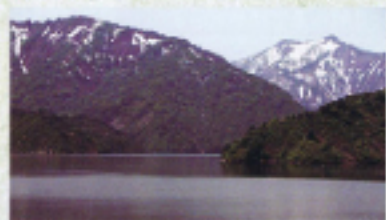
田子倉ダムから見る「越後三山只見国定公園」に指定されている広大な山岳地帯!