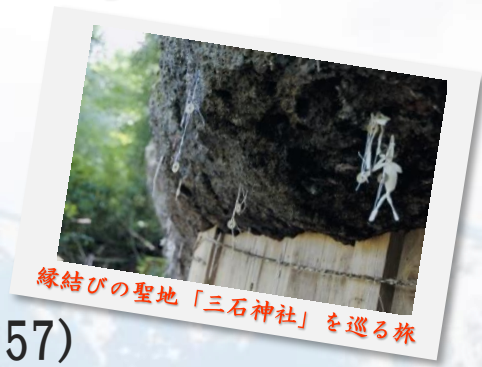
縁結びの聖地「三石神社」を巡る旅